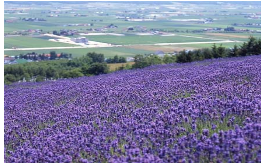
富良野 ラベンダー畑